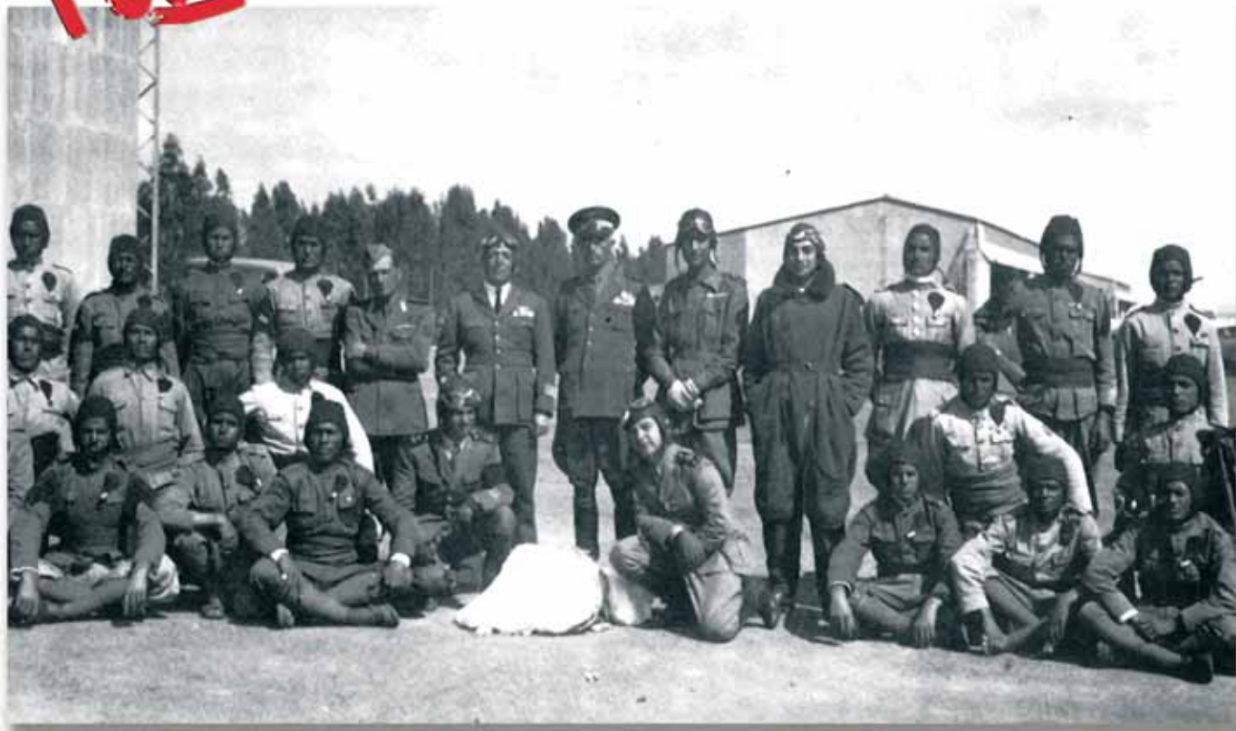
Gruppo di militari libici, brevettati paracadutisti, con i loro ufficiali