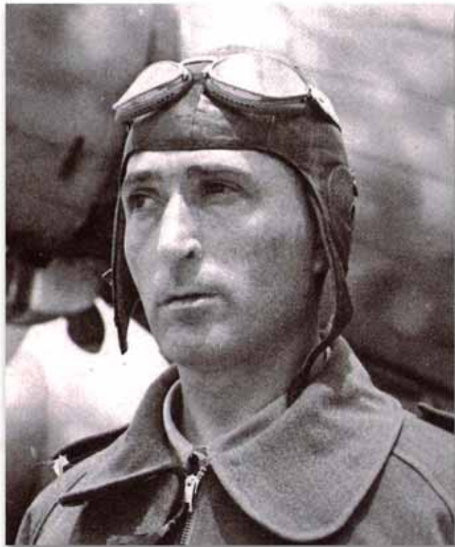
Italo Balbo, Maresciallo dell'Aria